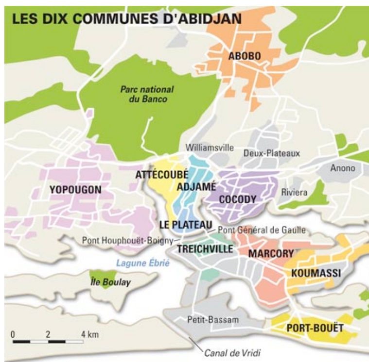
Carte 1. Les 10 communes d'Abidjan-ville

Cependant, avec l'accroissement de la population et l'extension de la ville par la création d'autres quartiers (Cocody, Marcory, Koumassi, Attécoubé, Abobo, Yopougon, etc.), il devenait de plus en plus difficile aux derniers arrivants de se regrouper par affinité ethnique pour espérer sauvegarder de la sorte leur culture et leur langue d'origine. Et la dynamique urbaine amorça un puissant processus de déculturation ou d'acculturation dont les principaux lieux de concrétisation étaient le milieu de vie (quartier, cour commune, maison), le lieu de travail (bureau, atelier), les lieux de rencontre (marché, maquis, hôpital, etc.) et surtout l'école d'où sortent depuis des années un tiers de diplômés, mais aussi d'innombrables cohortes de jeunes déscolarisés qui deviennent à la fois dépositaires et agents des nouvelles identités en construction. Ainsi Abidjan, ville cosmopolite, devint un lieu privilégié d'intenses interactions culturelles.