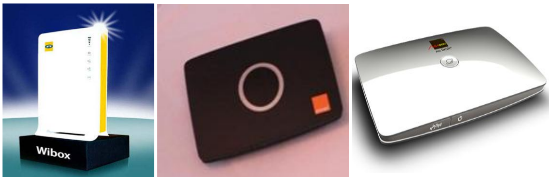
Image 3. Box Internet proposés par des opérateurs mobiles en Côte d'Ivoire et au Mali

Les « box Internet » sont des boîtiers wifi, qui permettent grâce à leur mode routeur de connecter en même temps à Internet par wifi ou par câble plusieurs ordinateurs, tablettes, Smartphones, etc. (comme avec les clés Internet, une carte SIM est embarquée dans le routeur. C'est elle qui permet les échanges de données via le réseau de l'opérateur de téléphonie.). Le débit de connexion avec ce dispositif oscille entre 3 et 5 Mbs. Ces dispositifs coûtent dans la plupart des pays en moyenne entre 39000fcfa et 49000fcfa. Les forfaits mensuels de connexion varient entre 19 000 FCFA et 49 000 FCFA par mois pour un téléchargement de données allant de 5 Go à 15 Go.