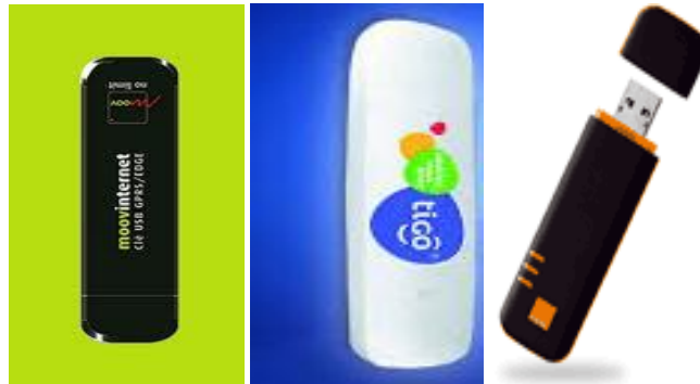
Image 2. Clés USB Internet des opérateurs mobiles en Côte d'Ivoire, au Sénégal et au Mali

Pour le dispositif « clé USB data Internet », grâce à une carte SIM embarquée dans la clé, les données sont émises et reçues via le réseau téléphonique mobile de l'opérateur. Dans l'espace francophone de la CEDEAO, le débit de connexion offert par ces clés varie entre 1 et 3 Mbs. Elles coûtent entre 10 000 et 19 000 FCFA 21 . Aussi, les volumes de données possibles pour le téléchargement sont compris entre 350 Mo et 5 Go. Le coût des connexions varie entre 200fcfa pour le jour avec 20 Mo de téléchargement à 19000fcfa par mois, avec 4 Go.