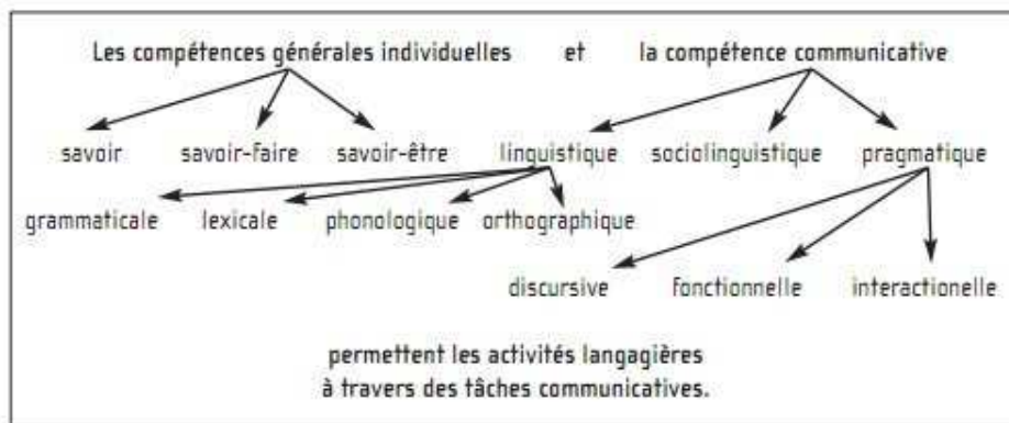
Figure 3 : illustration de l'approche par l'action par Goullier (2007)

résultats suivants selon Francis Goullier (2007) :