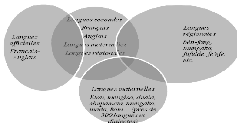
Figure 1 : différents groupes de langues au Cameroun

Au Cameroun, les statuts des langues sont de plusieurs ordres. Nous n'en retiendrons que quatre, en nous référant à la définition d'Adopo et al. (1997) : « [Le statut est] l'ensemble des données juridiques, politiques et économiques relatives à la langue » (13). L'anglais et le français, langues officielles, sont susceptibles de coexister avec des langues régionales, des langues secondes et des langues maternelles (LM). Les maternelles représentent éventuellement des langues véhiculaires, des langues régionales et surtout, comme dans cet article, des langues secondes. Pour assumer des rôles véhiculaires, à l'exemple des langues régionales, il faut que les LM jouissent d'une reconnaissance avérée, d'un nombre de locuteurs élevé et d'études scientifiques (Fishman, 1976). Le schéma suivant dépeint la stratification des langues au Cameroun.